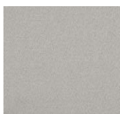
LL11 – Lola Poulain