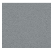
LL14 – Lola Nigelle