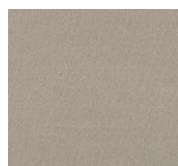
LL12 – Lola Crème caramel