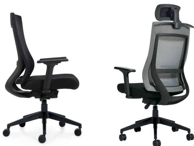
illustré avec un appui-tête en option